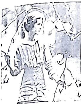
Edna St. Vincent Millay