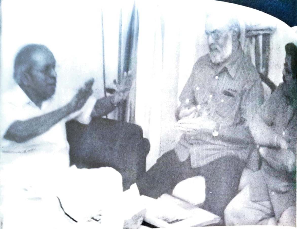
ഒ.എൻ.വി. ഗരത് എന്നിവർക്കൊപ്പം

മുള്ളപ്പോലെ വലിക്കുകോ വിടുകോ ചെയ്യുന്നത് നിനക്കൊക്കെ എന്നാടാ ദെണ്ണോ?"