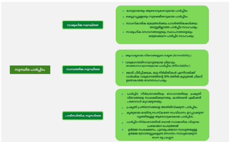
ചിത്രം.1.സുസ്ഥിര പാർപ്പിടം -ഘടകങ്ങളിലെ ആശയം