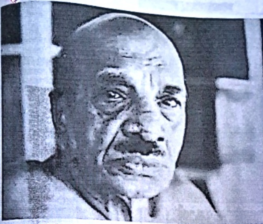
വൈക്കം മുഹമ്മദ് ബഷീർ