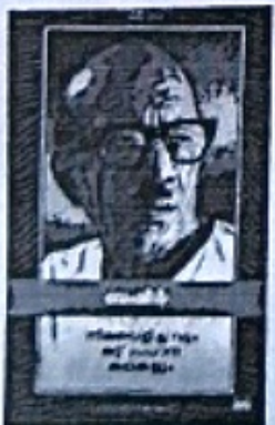
74 | വിജ്ഞാനകൈരളി | മേയ് 2023

ഇവിടെ കഥ ആരംഭിക്കുന്നതു തന്നെ സൂക്ഷ്മമായി വിവരണത്തിൽ ഇടയാക്കുന്നതിലും തുടക്കത്തിൽ തന്നെ അസാധാരണമായ ഒരു സംഭവമാണ് വിവരിക്കുന്നതെന്ന് വ്യക്തമാക്കാൻ ശ്രമിക്കുന്നു. ബുക്കർ പറയാനങ്ങായിരുന്നതാണ് തന്റെ പ്രണയം സാക്ഷാൽക്കരിക്കാനാകാതെ കിണരിന്റെ ആഴങ്ങളിലേക്ക് വീണ് ജീവിതത്തിന് വിരാമിട്ടു പുനർജന്മിച്ച സുന്ദരിയായ മാർഗ്ഗവിട്ടിയുടെ കഥയായിരുന്നു. നാടുകാർ പ്രേതഗൃഹമാക്കി മിനിയോടെ നോക്കിയിരുന്ന ആ വീട്ടിലിരുന്ന ബുക്കർ മാർഗ്ഗവിരുന്ന പോലുള്ള യുവതിയുമായി പ്രണയത്തിലായി.