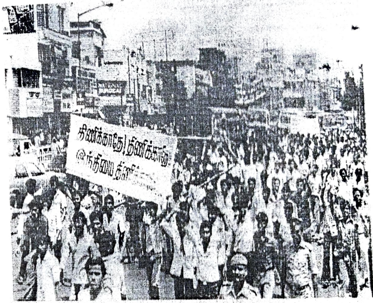
വിവിധ രാഷ്ട്രീയപാർട്ടികളുടെ അനുമതിയില്ലാതെ തിരുവനന്തപുരം സർവകലാശാലയിൽ നടന്ന സമരം

(കാലടി ശ്രീകേശവായ്യ സർവകലാശാലയിൽ നടത്തപ്പെട്ട അധ്യാപകനാണ് മലബാർ - 94470 41894)